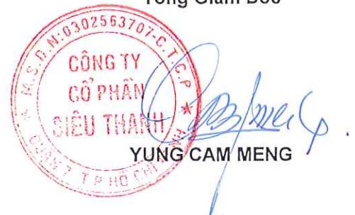
YUNG CAM MENG